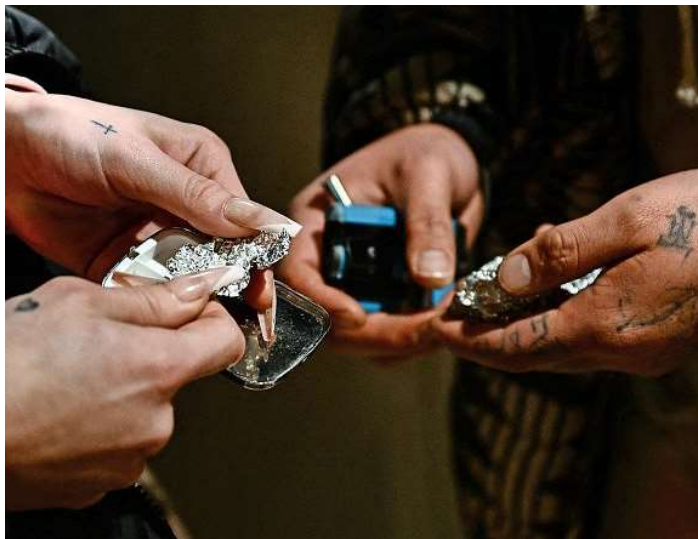
Le Canton de Fribourg a déployé un plan anti-fentanyl, cette drogue ultra-puissante qui a déjà fait des centaines de morts en Europe.

Enfin, le canton mise sur l'urgence vitale avec la distribution, fin février, de 50 sprays nasaux de naloxone au personnel du Tremplin. Cet antidote permet de bloquer instantanément les