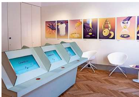
Le musée traite de l'univers de l'argent de façon à la fois sérieuse et ludique.

«L'aménagement du musée a coûté une somme en millions à deux chiffres. Et les frais de fonctionnement se montent à une somme en millions à un chiffre.»