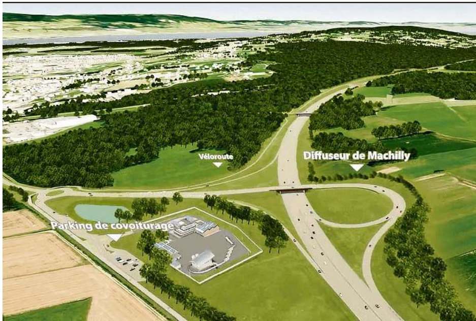
L'autoroute A412 doit relier Machilly à Thonon-les-Bains, en Haute-Savoie. Ici, une image du diffuseur de Machilly. Vectuel - Eiffage