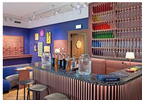
Au Moneybar, on peut déguster des sirops aux noms d'alcools forts détournés, comme le «Cashless Colada» ou le «Gini Tonic».

Le nom du musée reste un peu en travers de la gorge: Moneyverse. On comprend que les anglophones ont encore raflé la mise avec cette contraction de Money et Universe, en français l'univers de l'argent. Mais on se