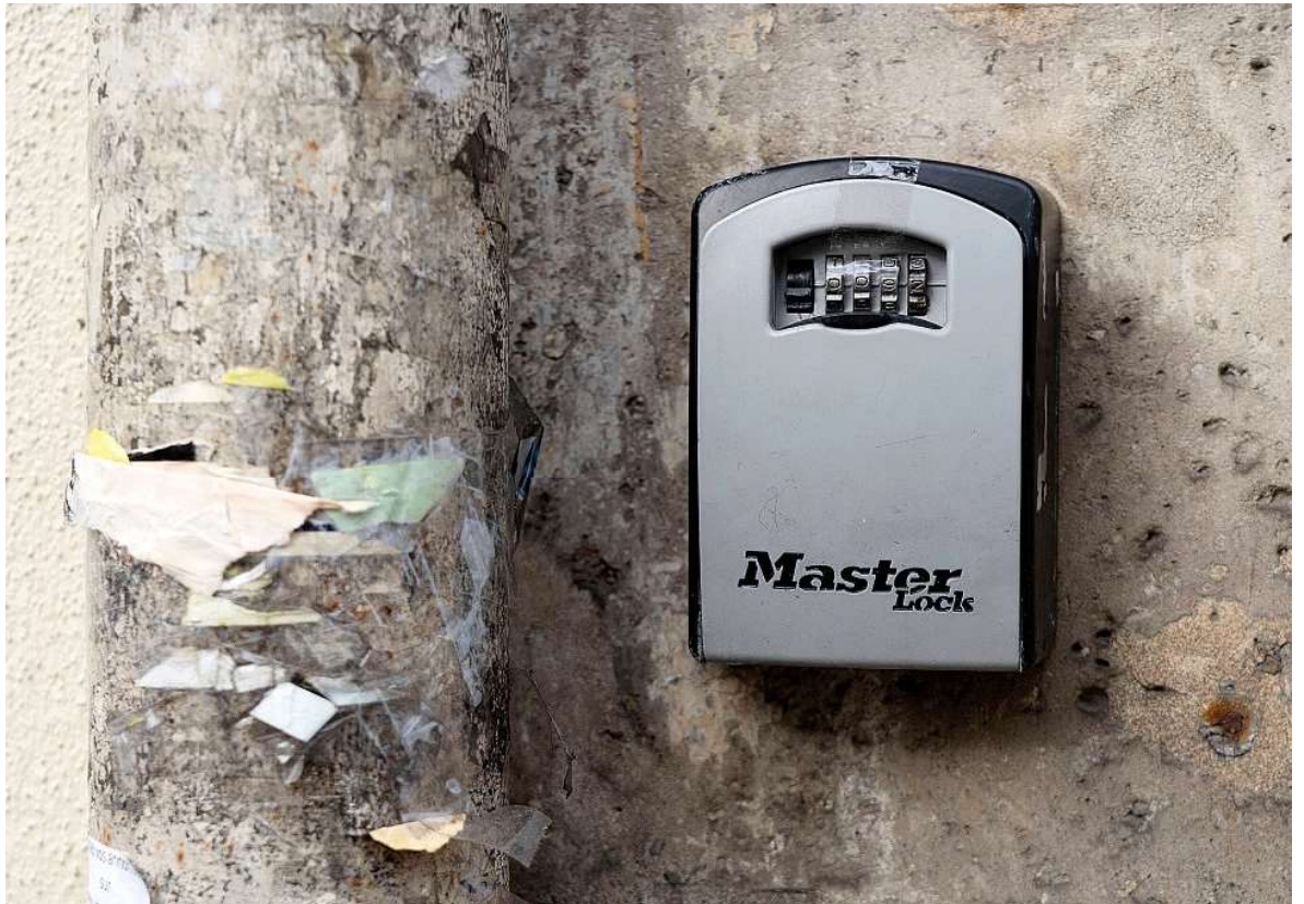
Genève, à l'instar d'autres centres urbains, veut renforcer la lutte contre la location abusive d'appartements via les plateformes.

Ce projet mûrit alors que des élus au Grand Conseil ont pointé plusieurs fois, ces dernières années, des lacunes dans le contrôle de ce marché, et réclamé un durcissement de la loi.