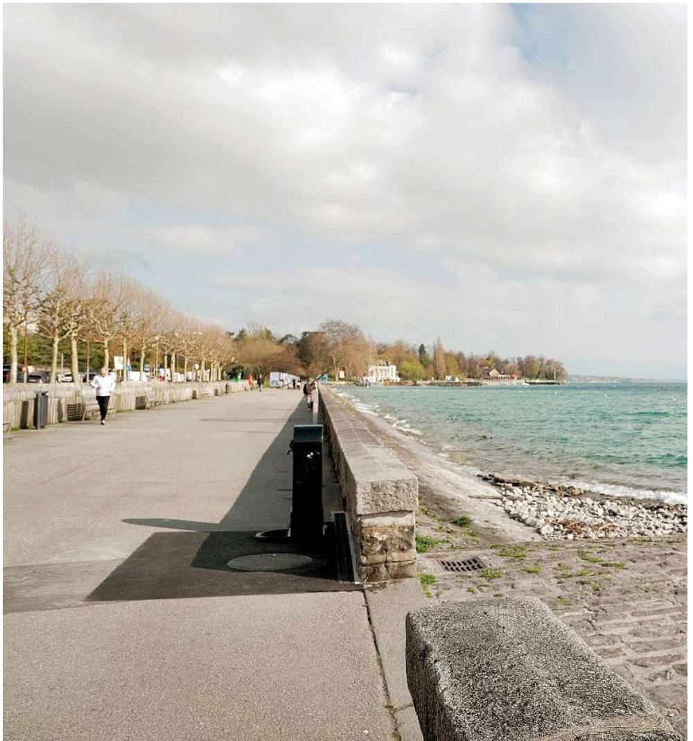
Plus de 1150 signatures demandent un point de baignade canin au quai Wilson. Face aux canicules, les propriétaires dénoncent des restrictions croissantes.

La communicante ajoute: «Les parcs à chiens doivent cohabiter avec de nombreux autres usages de l'espace public et la proximité d'habitations dans la ville la plus dense de Suisse limite les possibilités d'aménagements. Le quartier des Grottes-Saint-Gervais étant fortement