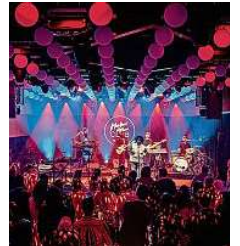
L'accès au Montreux Jazz Club de Genève sera libre et gratuit. DR

Le programme se clôturera samedi avec deux artistes proposant