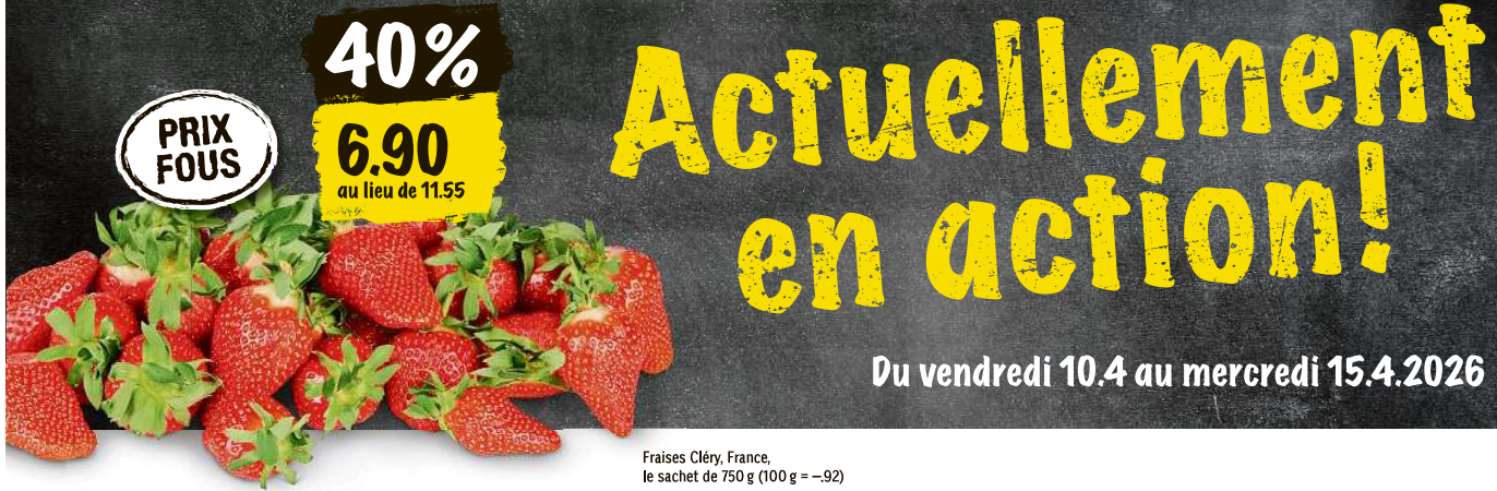
Fraises Cléry, France, le sachet de 750 g (100 g = -92)