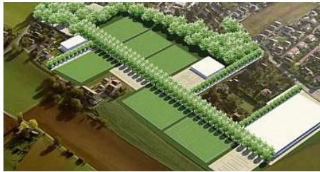
Une vue d'artiste du projet de Crotte-au-Loup.

Une aubaine pour le Conseil d'Etat, qui cherche à faire démanteler le Cycle d'orientation du Renard sur la parcelle actuellement occupée par l'académie du Servette FC, à Balexert. Or, le Canton est déjà en conflit avec des ha-