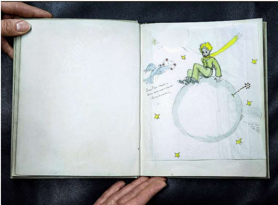
Dessin original aquarellé du «Petit Prince» assis sur sa planète, extrait d'un exemplaire signé de Saint-Exupéry.