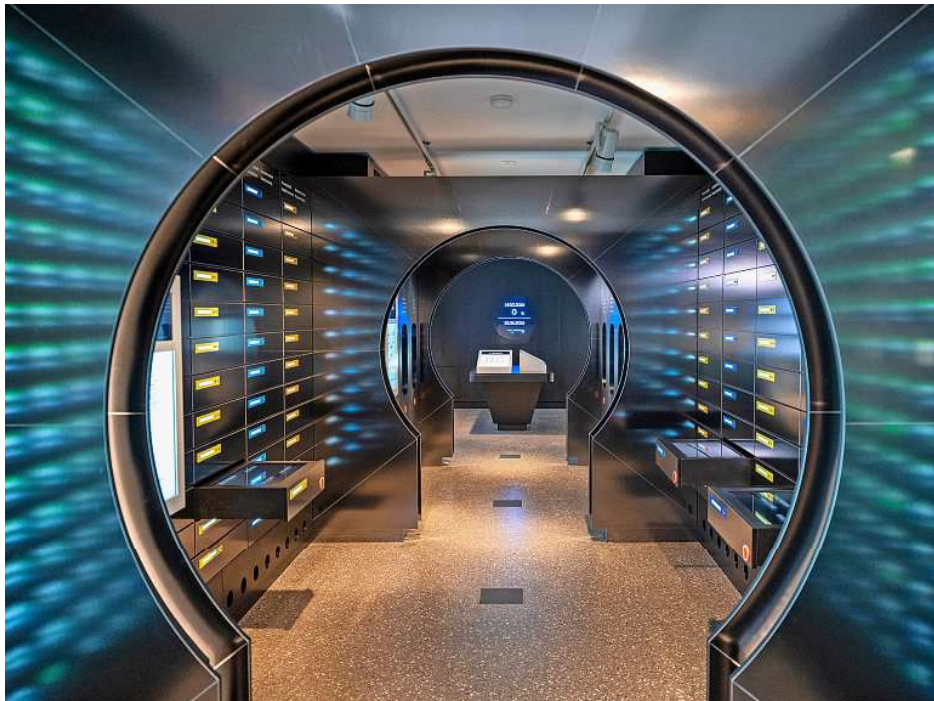
La BNS a mis sur pied le Moneyverse avec l'aide du Musée d'histoire de Berne.

Autre possibilité: aller picer ce qui vous intéresse au niveau historique. Comme savoir pour-