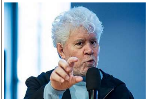
Avec «Amarga Navidad», l'Espagnol Pedro Almodóvar postule à une 7 e sélection en compétition (mais aucune Palme d'or).