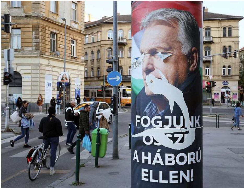
Une affiche de campagne représentant Viktor Orbán, accompagné du texte «Unissons-nous contre la guerre».

«Le gouvernement nous a beaucoup aidés avec les gels de prix», souligne Margit, élue du Fidesz. Sa pension reste très