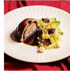
Le gourmand et délicieux pithiviers du Lion d'Or carougeois.