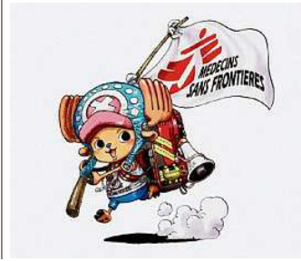
Illustration de «Chopper MSF» par Eiichiro Oda / Shueisha ©MSF