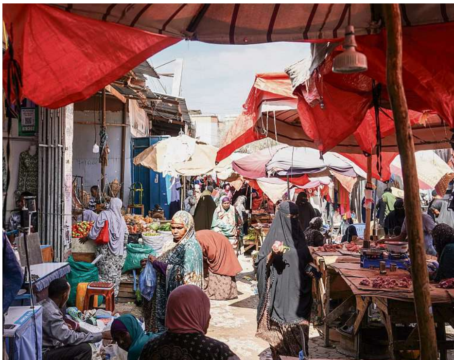
Les allées animées d'un marché d'Hargeisa, capitale du Somaliland, où l'incertitude grandit. Théophile Simon

«Le Somaliland ne dispose d'aucune réserve stratégique. Nous ne pouvons que gérer les stocks des entreprises, en redirigeant leur diesel vers la production d'électricité. Nous avons environ un mois et demi avant que la situation ne devienne