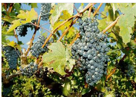
Belle grappe de pinot noir dans une vigne romande. Il vient de Ioin, ce cépage-là. Georges Meyrat

L'étude ne s'est pas arrêtée à ce pépin médiéval. En analysant 54 échantillons allant de